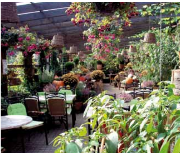
100 zitplaatsen overdekt buitenterras