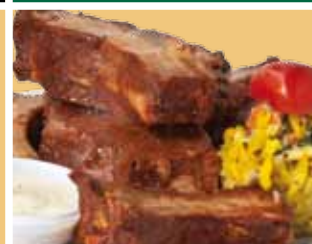
Spare ribs 11,50