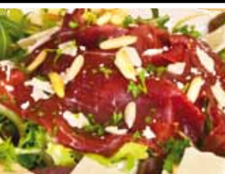
Runder carpaccio 7,95