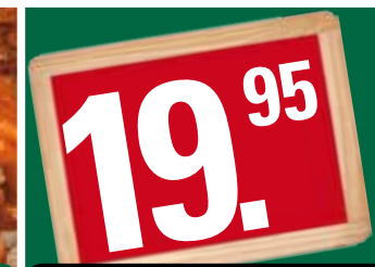
BBQ de Luxe 19,95