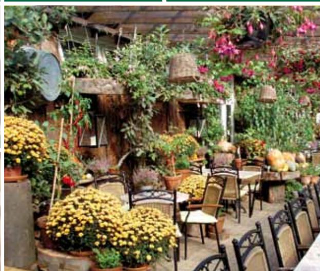
Overdekt terras en bloementuin