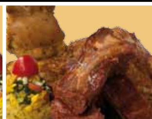
Royale mixed grill 13,50