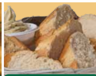
Mandje stokbrood 3,25