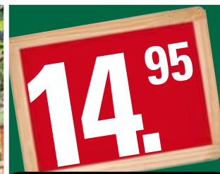
BBQ populair 14,95