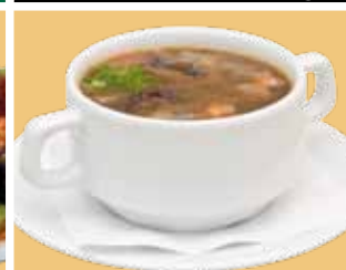
Soep v.d. dag 5,50