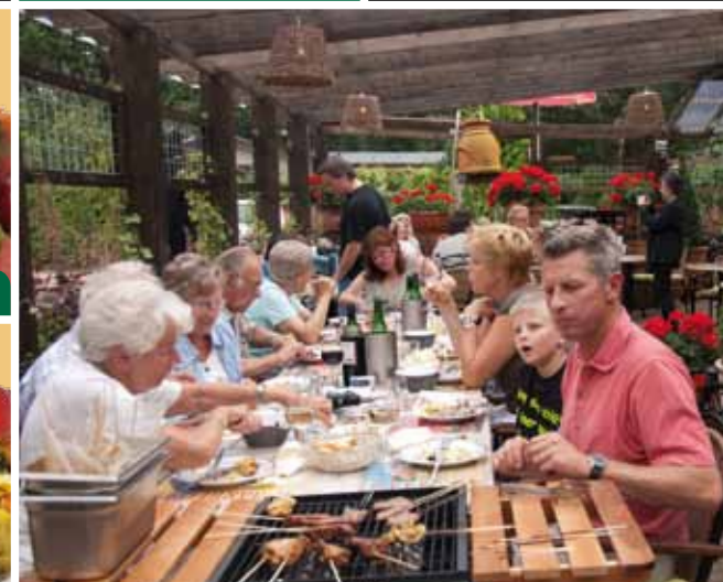
Overdekt terras en bloementuin