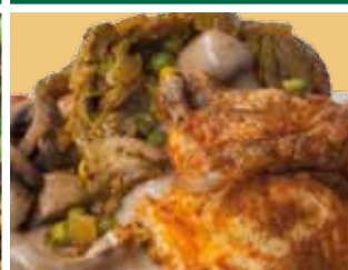
Boeren halve kip 11,00