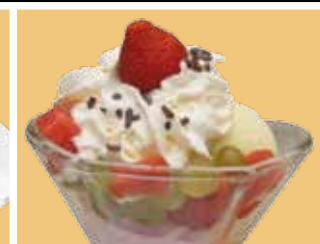
Coupe Zuiderzand 5,50