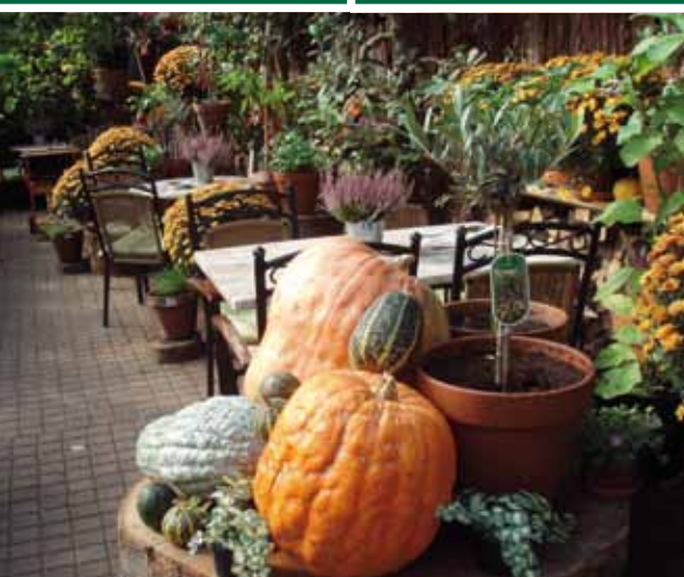
Overdekt terras met kruidentuin