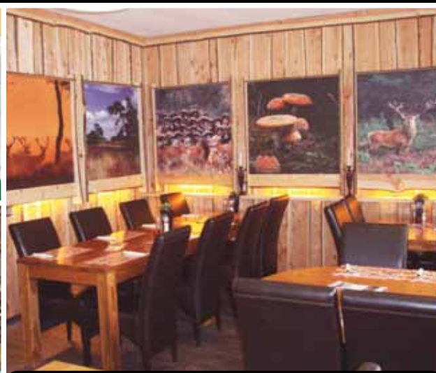
100 zitplaatsen binnen restaurant