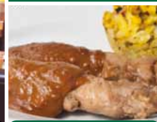
Reuze kipsaté 11,50