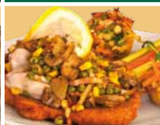
Boeren schnitzel 12,50