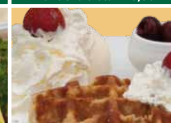
Warme Luiksewafel 6,50