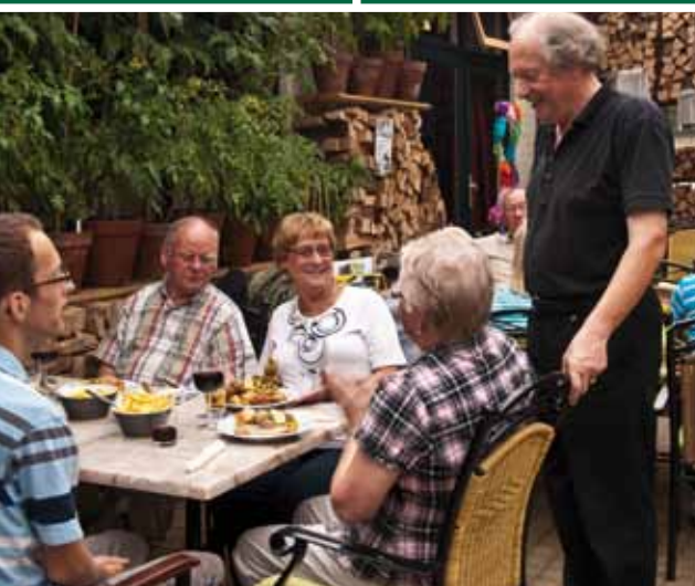
Buiten en toch droog