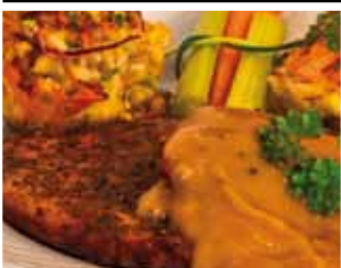
Dubbele Pepersteak 11,50